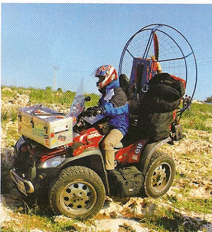
Gerry Mayr unterwegs mit viel Gepäck.