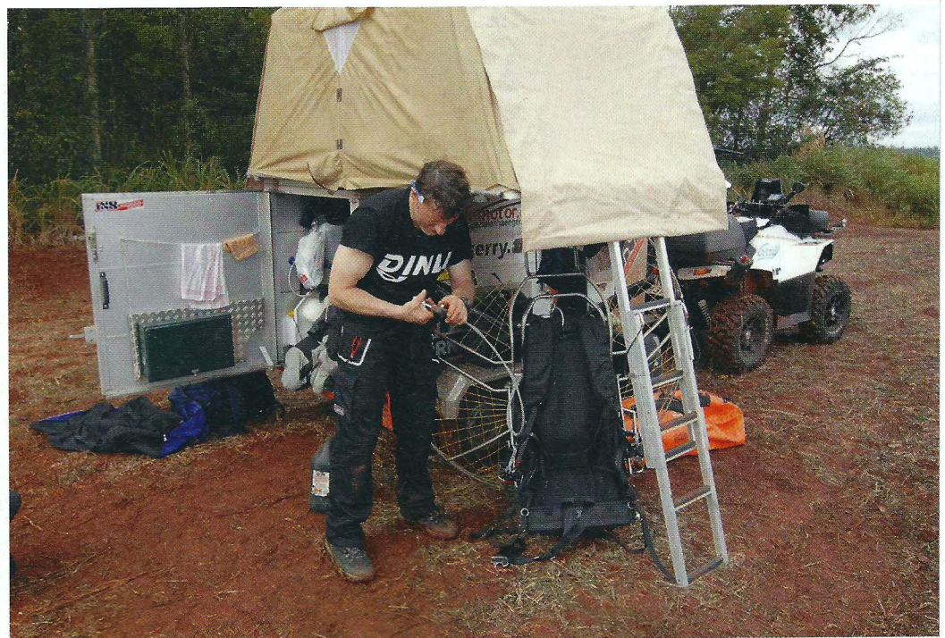
Smarty: Raum ist in der kleinsten Hütte.

ich bin kein Tourist mehr in Südamerika sondern bin frei und lebe hier mittendrin! Schon auf den ersten Metern bin ich mir sicher dass ich mit Gringo einen guten Reisepartner habe. Die 42 PS in der LOF Ausführung ziehen den Smarty, der sich schon bei anderen Reisen bewährt hat, wie nichts.